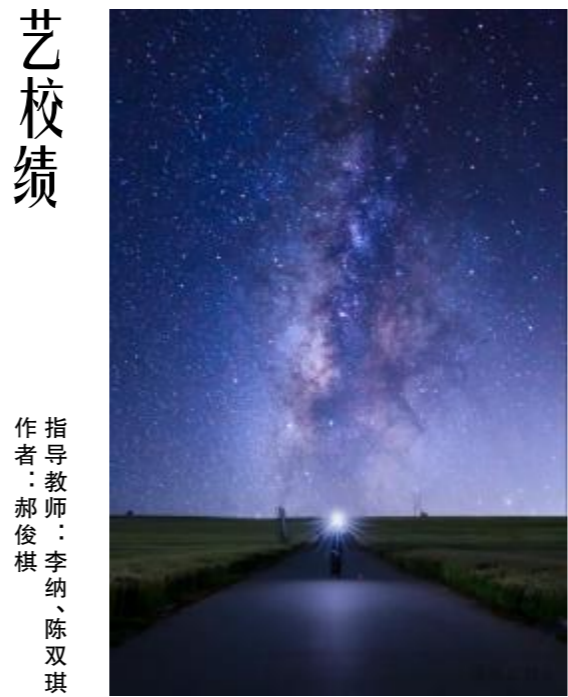
指导教师:李纳、陈双琪 作者:郝俊棋